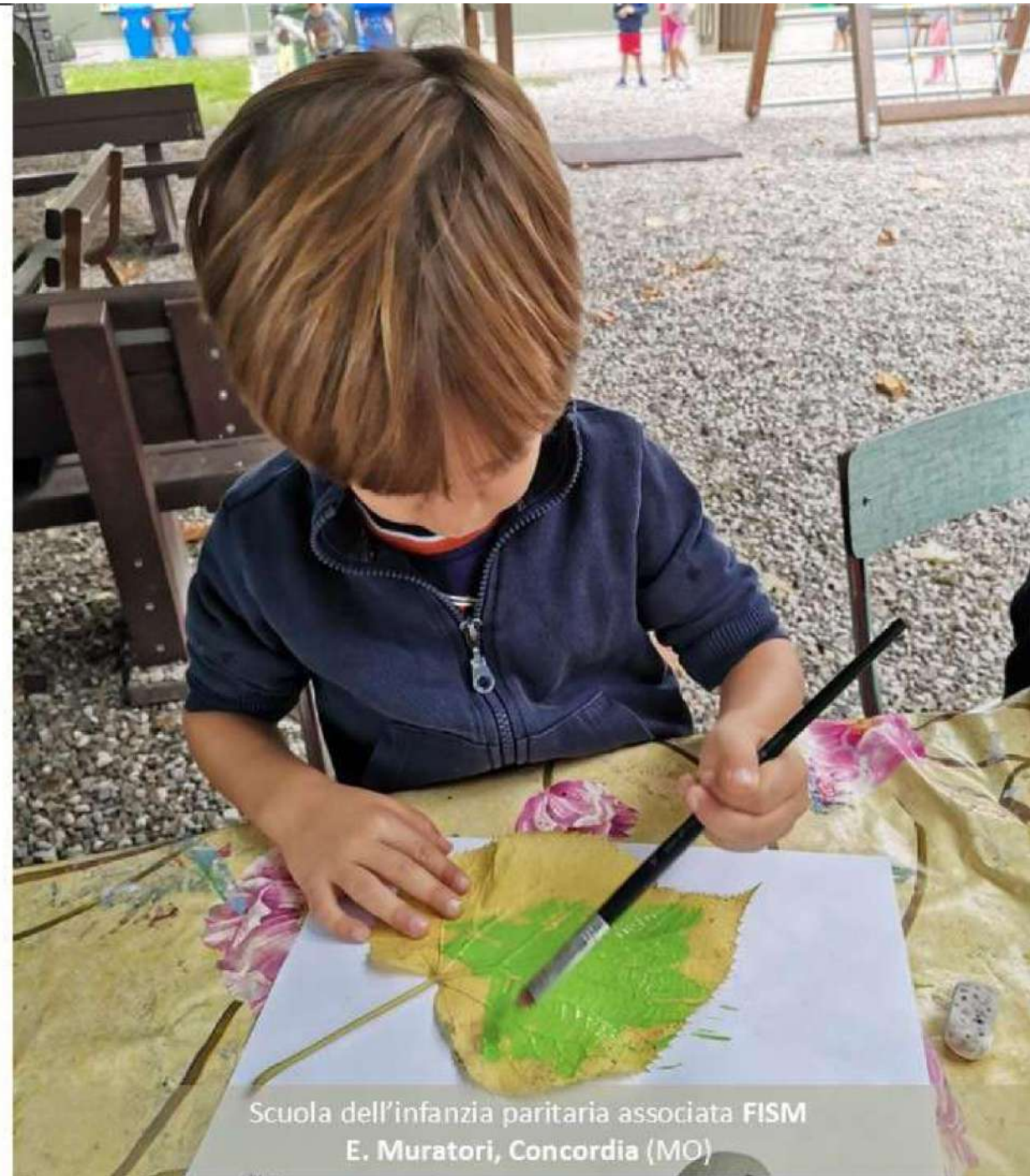
Scuola dell'infanzia paritaria associata FISM E. Muratori, Concordia (MO)