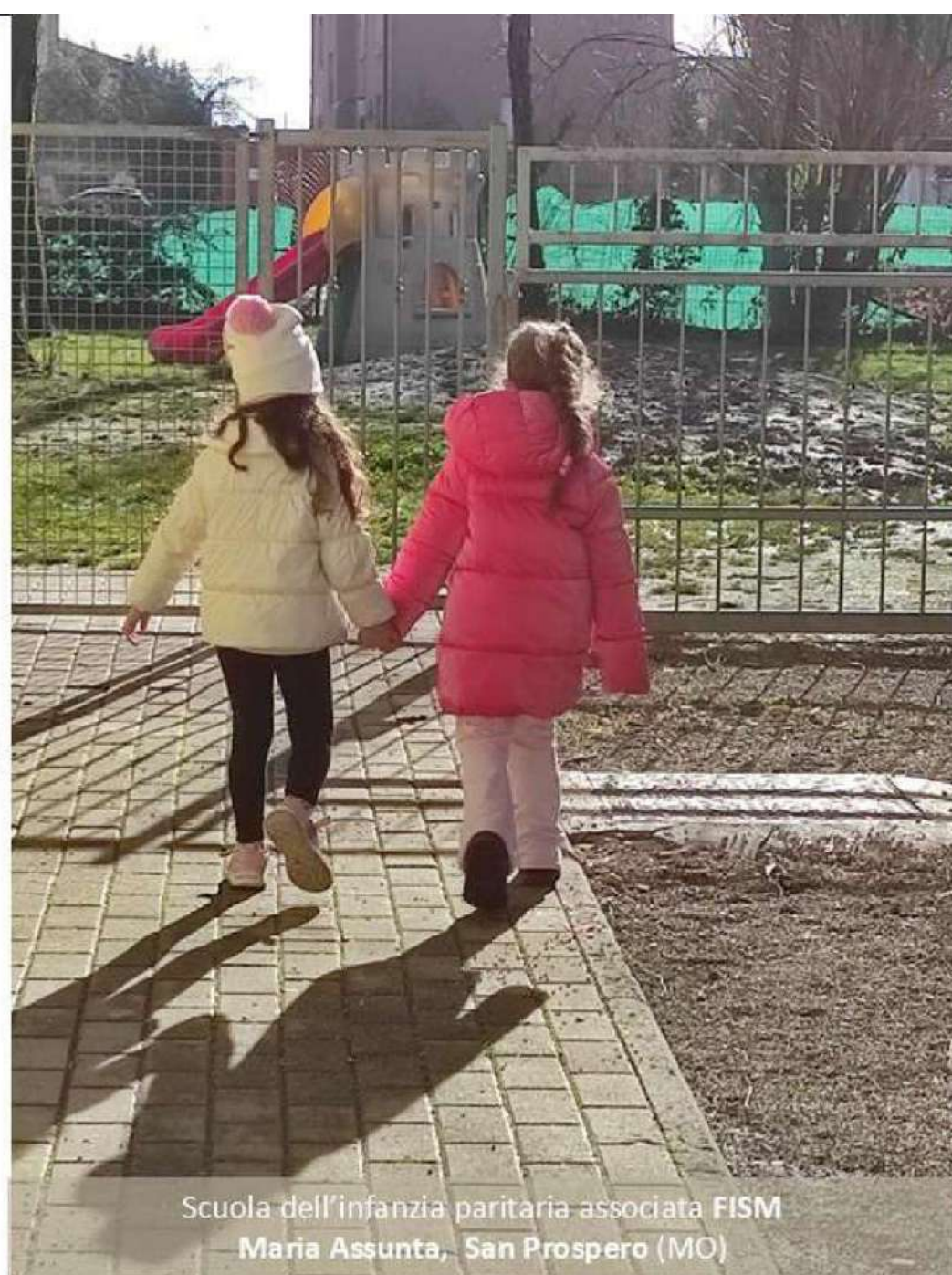
Scuola dell'infanzia paritaria associata FISM Maria Assunta, San Prospero (MO)