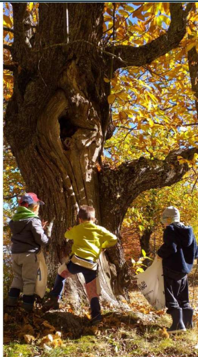
Scuola dell'infanzia RICCI – SESTOLA (MO)