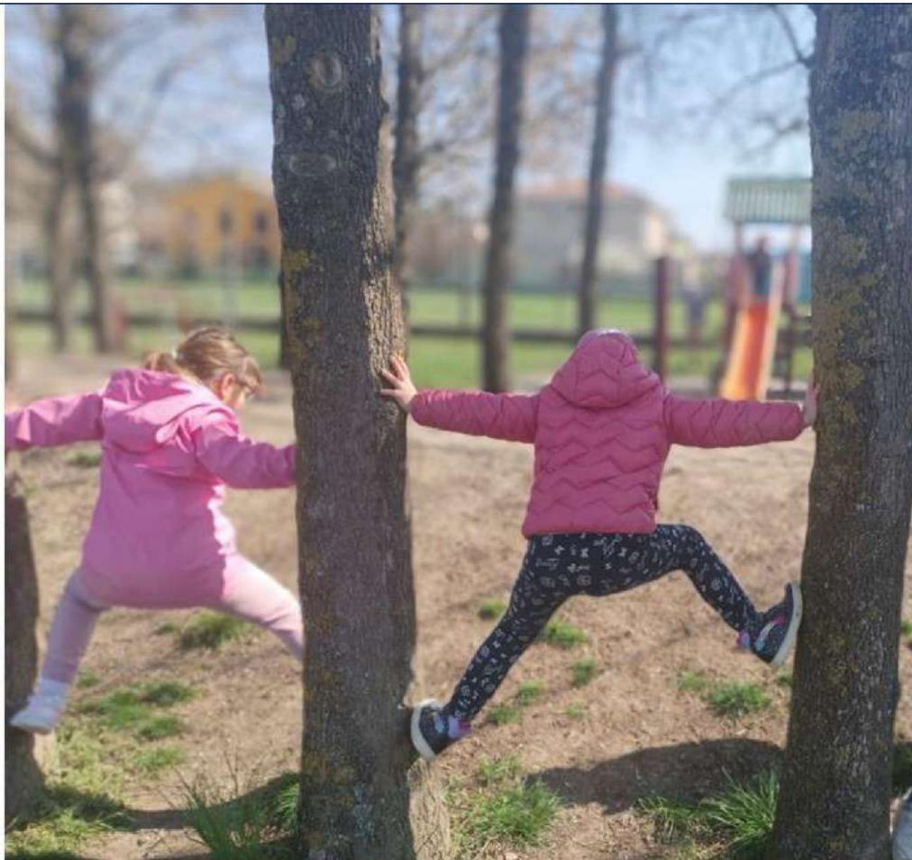
Scuola dell'infanzia paritaria associata FISM «S. Maria ad Nives» Quarantoli, Mirandola (Mo)