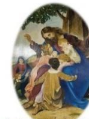
Scuola dell'infanzia "San Giuseppe" Fiumalbo (MO)